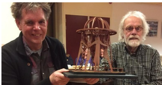
Stichting De Grijpvogel/ maart 2020

In het midden is een meanderende bank geplaatst, een ontwerp van keramist – kunstenaar Peter Hiemstra. In de zitbank zijn de coöperaties verwerkt die zijn opgericht in het kerngebied van de voormalige Coöperatieve Voorschotbank Oldeberkoop en ook een verwijzing naar toekomstige coöperaties, zoals op het gebied van duurzaamheid en crowd-funding.